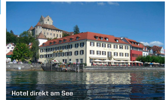
Hotel direkt am See

6-TAGE REISE MONTAG, 29.04. – SAMSTAG, 04.05.2025