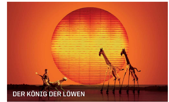
DER KÖNIG DER LÖWEN