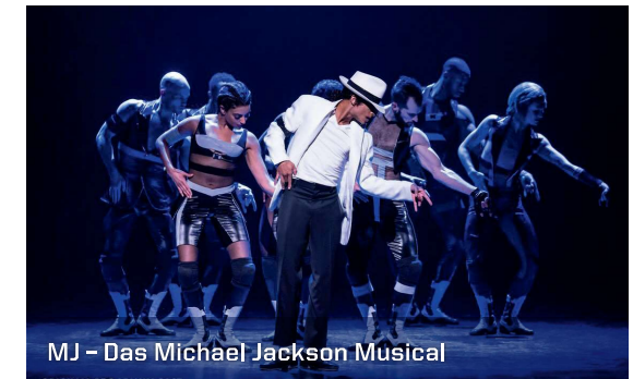
MJ – Das Michael Jackson Musical